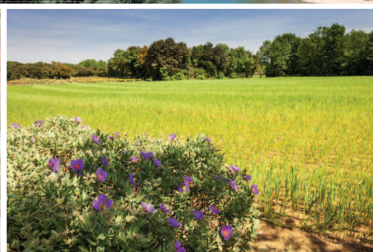
Mémoires de Garrigue